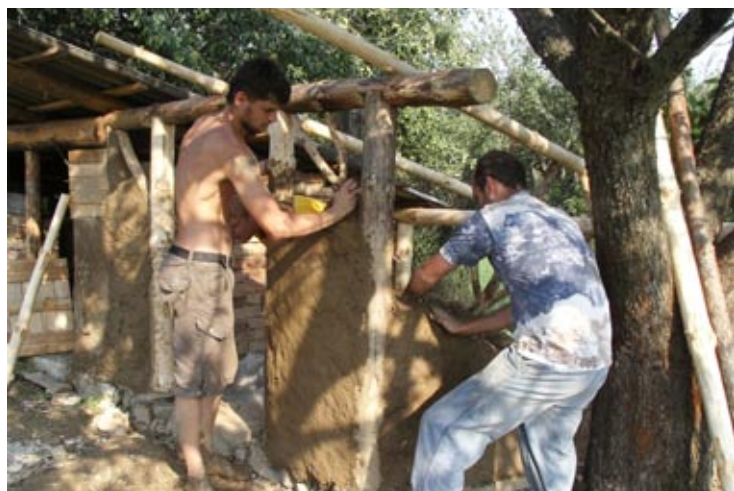
STAVBA HOSPODÁRSKEJ BUDOVY S HLINENÝMI STENAMI VÝUČBA REMESIEL - HRNČIARSTVO. PAŤA PRIPRAVUJE HLINU NA TOČENIE