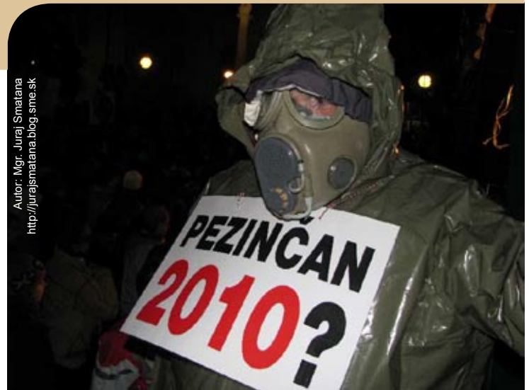
Autor: Mgr. Juraj Smatana http://jurajsmatana.blog.sme.sk

Inšpekcia ŽP 5.3.2008 zrušila rozhodnutie, ktorým sa vylučoval odkladný účinok odvolania (a ktorým sa umožňovala okamžitá výstavba skládky). Skládku sa teda nemala stavať do ukončenia vyriešenia odvolaní. Napriek tomu 2. mája zistili zástupcovia mesta a občianskej iniciatívy že sa napriek tomu - nezákonne – skládka stavia ! Podali trestné oznámenie pre podozrenie z trestného činu marenia výkonu úradného rozhodnutia. Privolaný Inšpektorát ŽP sa vyhovárať že zistil iba „ťažbu hliny“ napriek tomu že tam boli vybudované súčasti skládky ako napríklad akumulácia nádrž... Pezinčania podali sťažnosť na postup Inšpekcie ŽP v Bratislave a zorganizovali ďalšiu protestný pochod. Medzitým Manovci priviedli celú kauzu na „americkú firmu“ Westminster Brothers (WB),