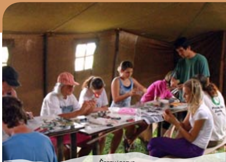
ŠPERKÁRSTVO ČISTENIE NAZBIERANÝCH BYLINIEK

Ak sa Vám Ekotábor zapáčil, tak sa prídte pozrieť a zažiť nezabudnuteľné chvíle aj Vy, možnosť na to budete mať aj na budúci rok!