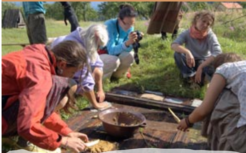
VÝROBA RUČNÉHO PAPIERA