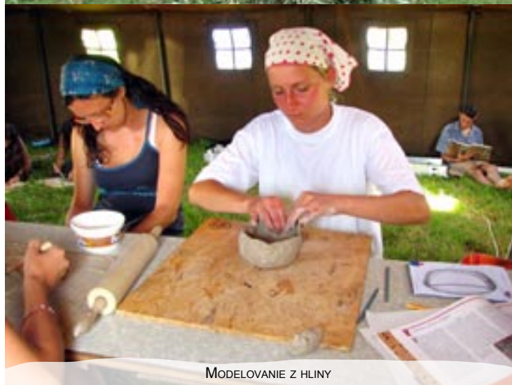
MODELOVANIE Z HLINY