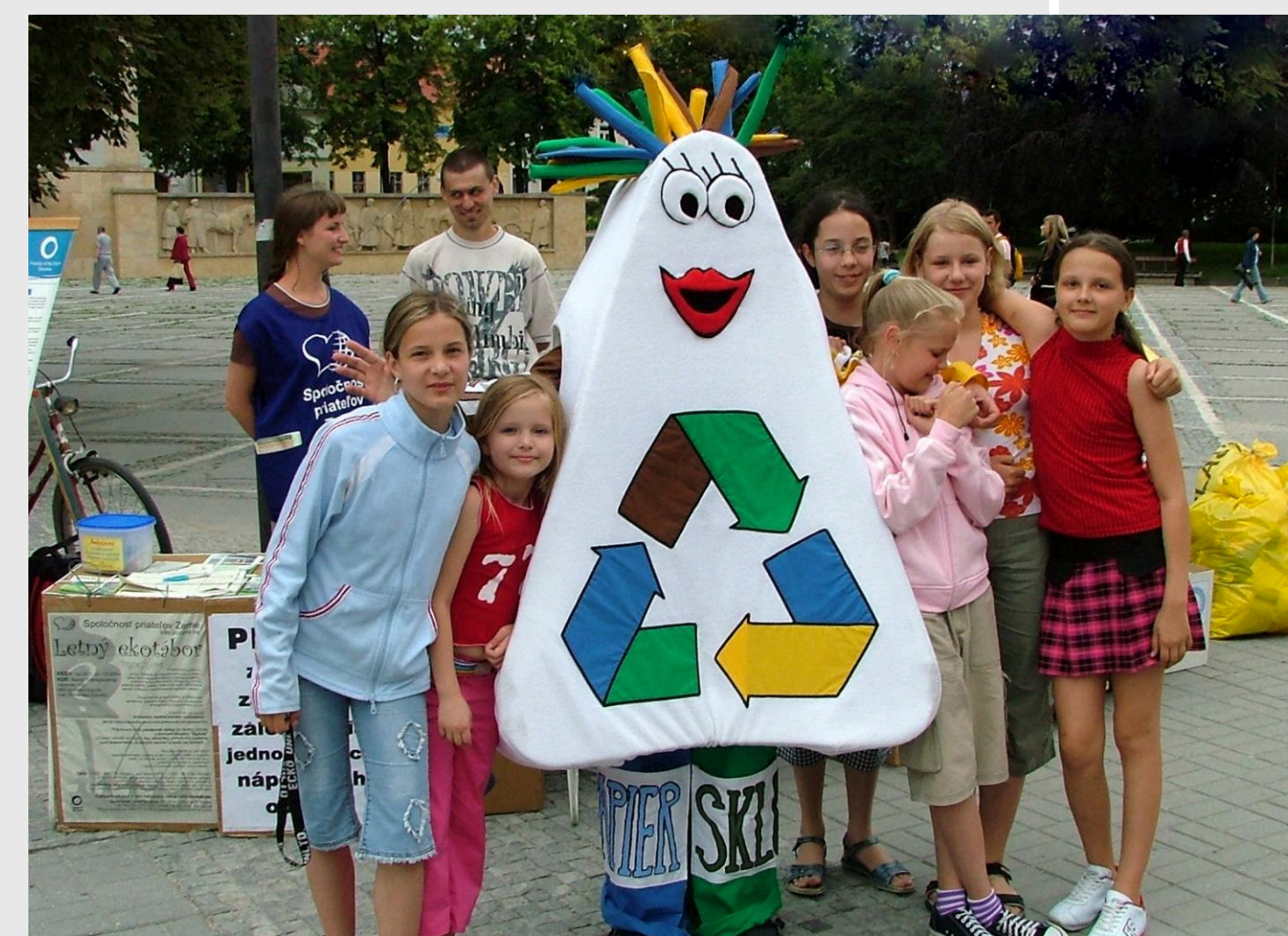
Deti sú naša budúcnosť a preto je dôležité, aby pochopili význam separácie a recyklácie odpadov.