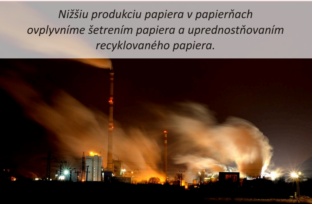
Nižšiu produkciu papiera v papierňach ovplyvníme šetrením papiera a uprednostňovaním recyklovaného papiera.

Na Slovensku sa vyprodukuje ročne cca 11 miliónov ton odpadov. Z toho až 1,7 milióna ton komunálnych odpadov - teda odpadov, ktoré vznikajú u každého z nás.