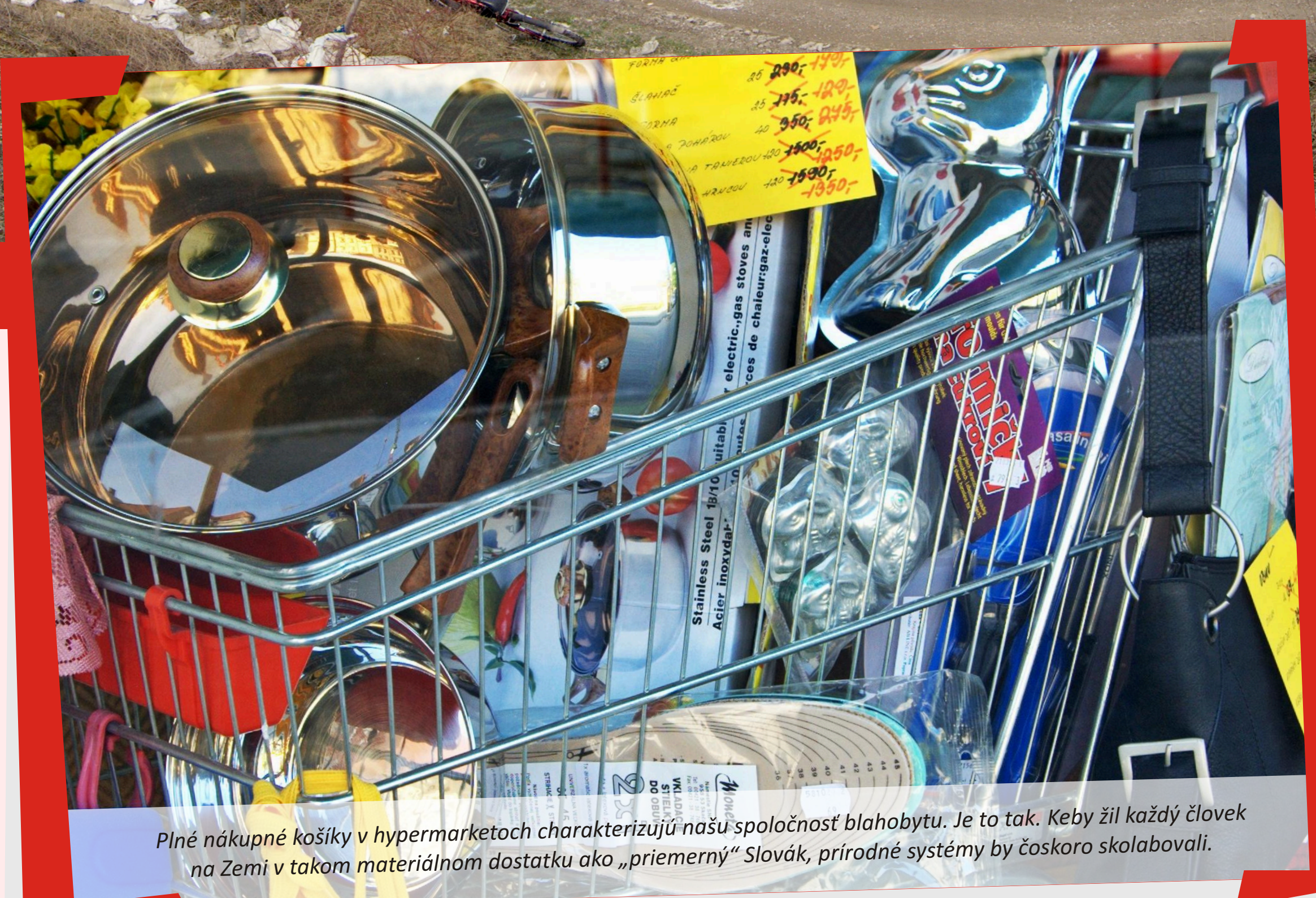
Plné nákupné košíky v hypermarketoch charakterizujú našu spoločnosť blahobytu. Je to tak. Keby žil každý človek na Zemi v takom materiálnom dostatku ako „priemerný“ Slovak, prírodné systémy by čoskoro skolabovali.