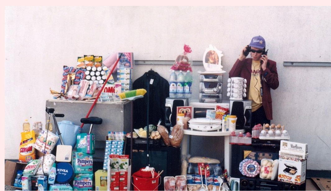
Tovar je zabalený do množstva veľakrát nepotrebných obalov.