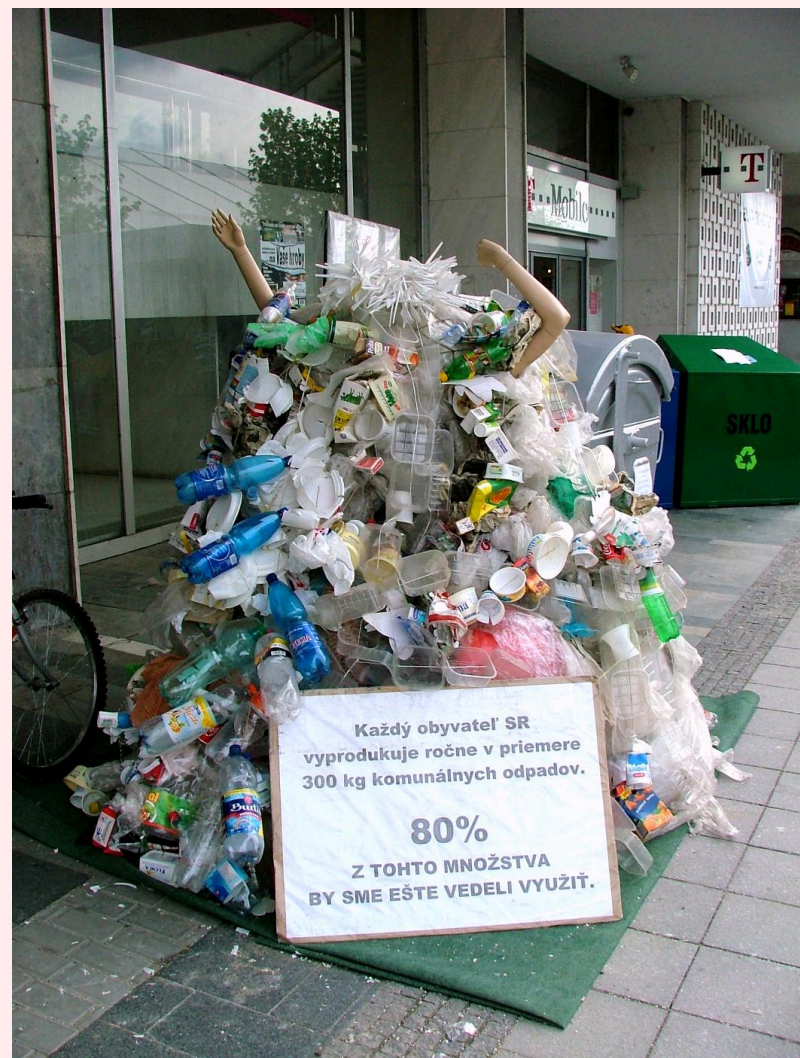
Každý obyvateľ SR vyprodukuje ročne v priemere 200 kg komunálneho odpadu. Z TOHTO MNOŽSTVA BY SME EŠTE VEDELI VYUŽIŤ. 80%

Teoreticky by každý obyvateľ mohol v priemere vyseparovať okolo 250 kg komunálneho odpadu. V skutočnosti to však v roku 2007 bolo 16 kg.