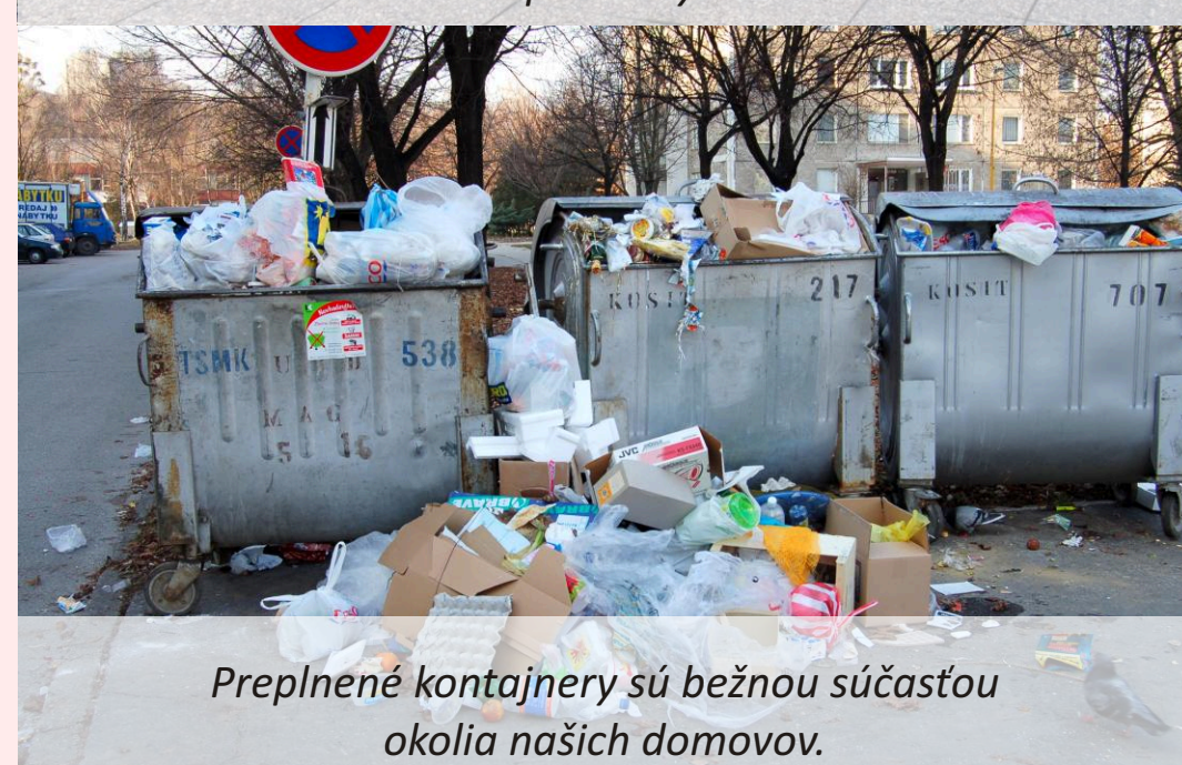
Preplnené kontajnery sú bežnou súčasťou okolia našich domovov.

O tom, koľko odpadov vyprodukujeme, rozhodujeme my! Rozhoduje o tom náročnosť nášho životného štýlu a schopnosť uvedomiť si jeho dopady na životné prostredie, budúce generácie a zdravie.