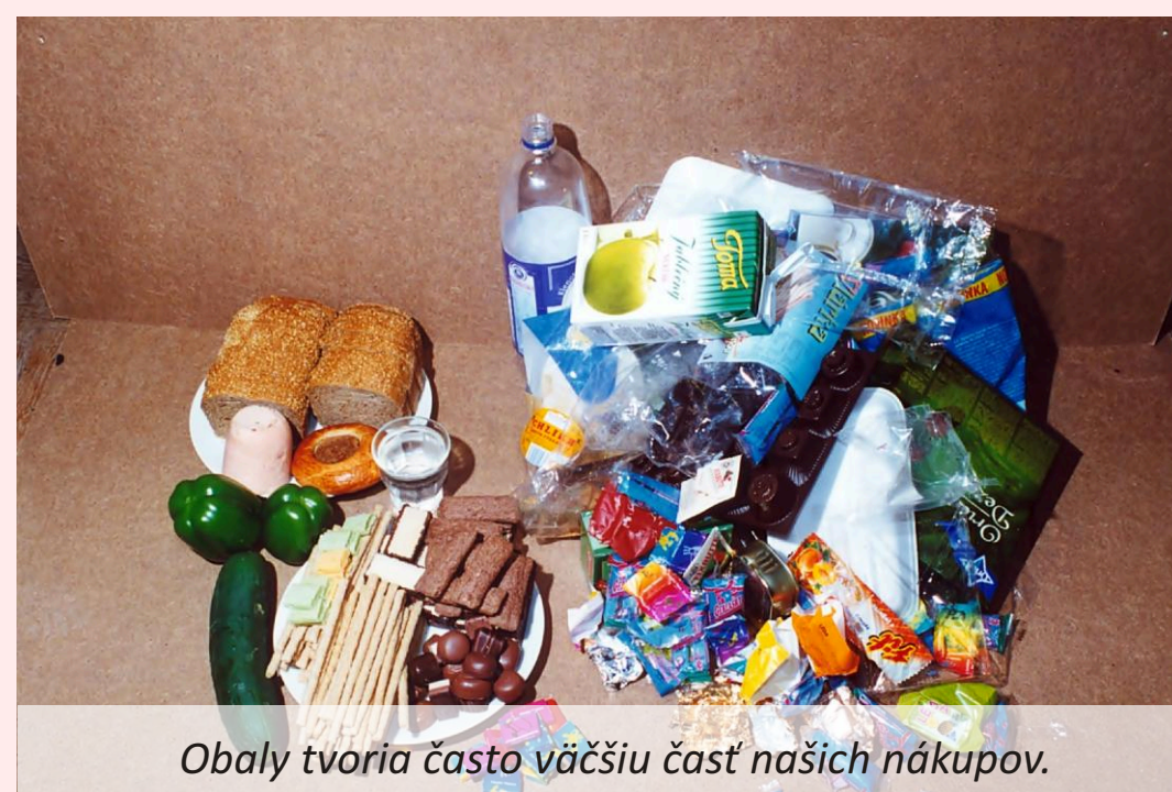
Obaly tvoria často väčšiu časť našich nákupov.

Príklad: kúpená vec je zvyčajne zabalená. Po jej vybalení vzniká odpad z obalov. Potom vec používame a po nejakom čase sa opotrebuje. Buď ešte funguje a my sme sa rozhodli, že chceme novší typ; alebo sa už táto vec celkom používaním zničila a stáva sa z nej nepotrebná vec. A takto vzniká odpad z domácnosti, s ktorým sa najviac stretávame, inak nazývaný i komunálny odpad.