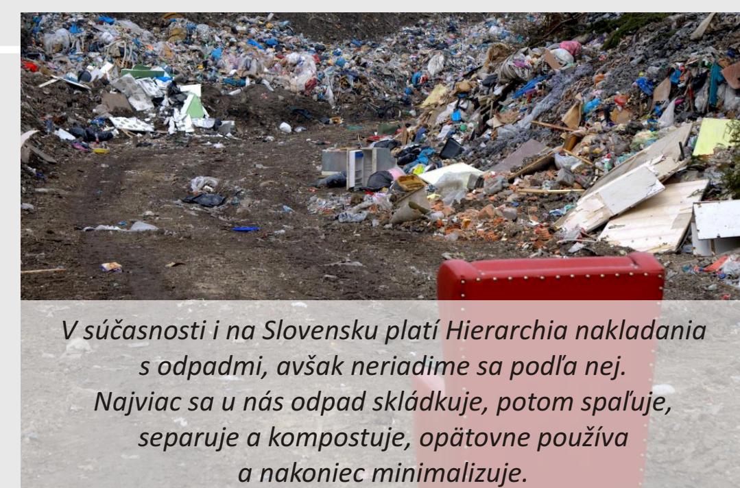
V súčasnosti i na Slovensku platí Hierarchia nakladania s odpadmi, avšak neriadime sa podľa nej. Najviac sa u nás odpad skládkuje, potom spaľuje, separuje a kompostuje, opätovne používa a nakoniec minimalizuje.