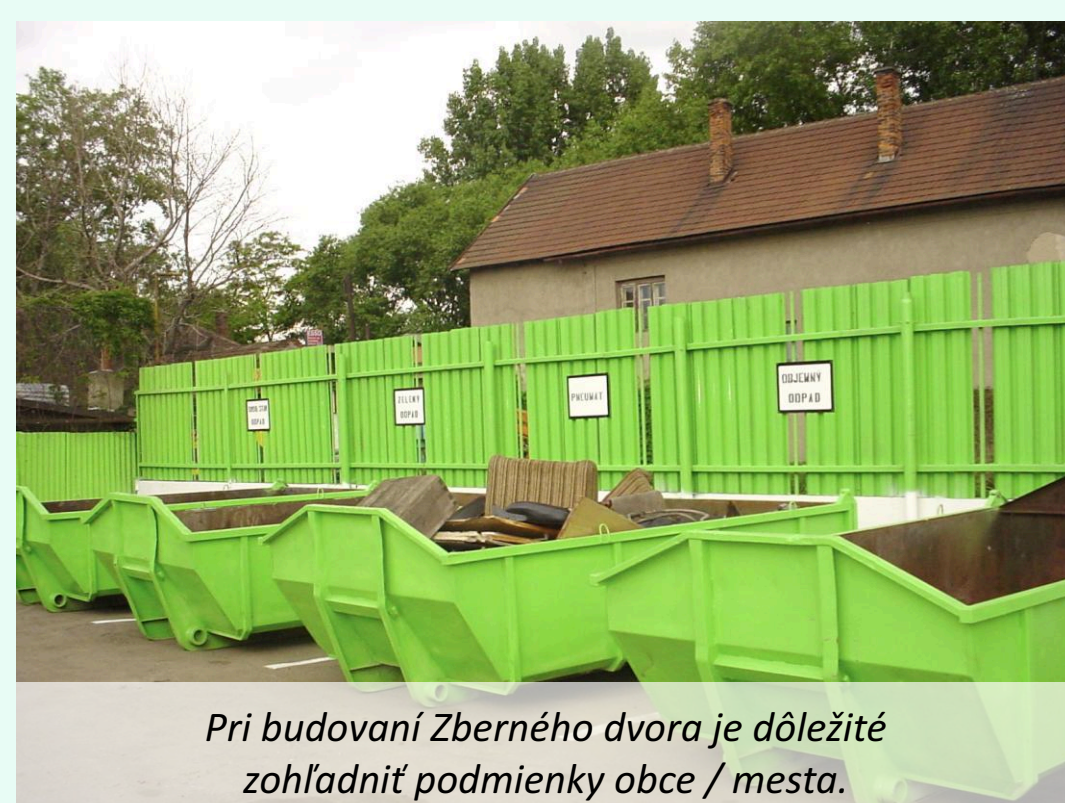
Pri budovaní Zberného dvora je dôležité zohľadniť podmienky obce / mesta.

výkupne druhotných surovín - vykupovanie vybraných surovín za úhradu (papier, železné a neželezné kovy) alebo mobilné výkupne druhotných surovín - vykupovanie vybraných surovín prebieha tak, že za obyvateľmi prichádza výkupca a odoberá od nich za poplatok alebo inú odmenu vyseparovanú surovinu.