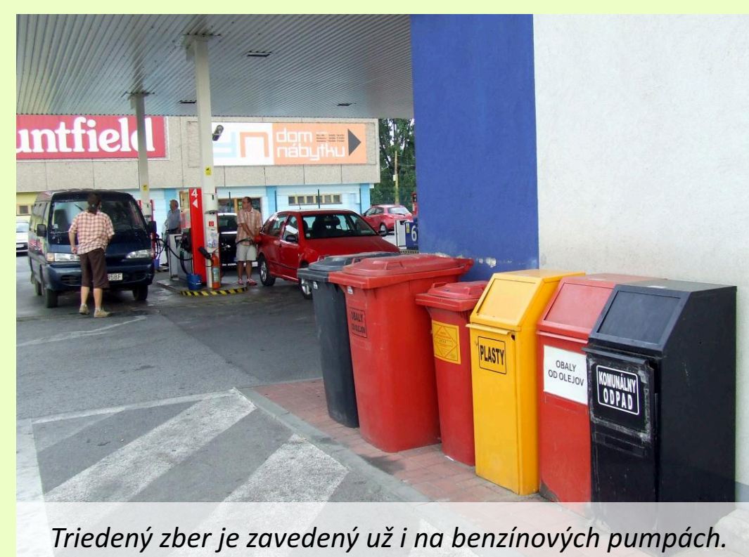
Triedený zber je zavedený už i na benzínových pumpách.

dôvodom je aj dodržiavanie miestneho VZN o odpadoch a Zákona o odpadoch.