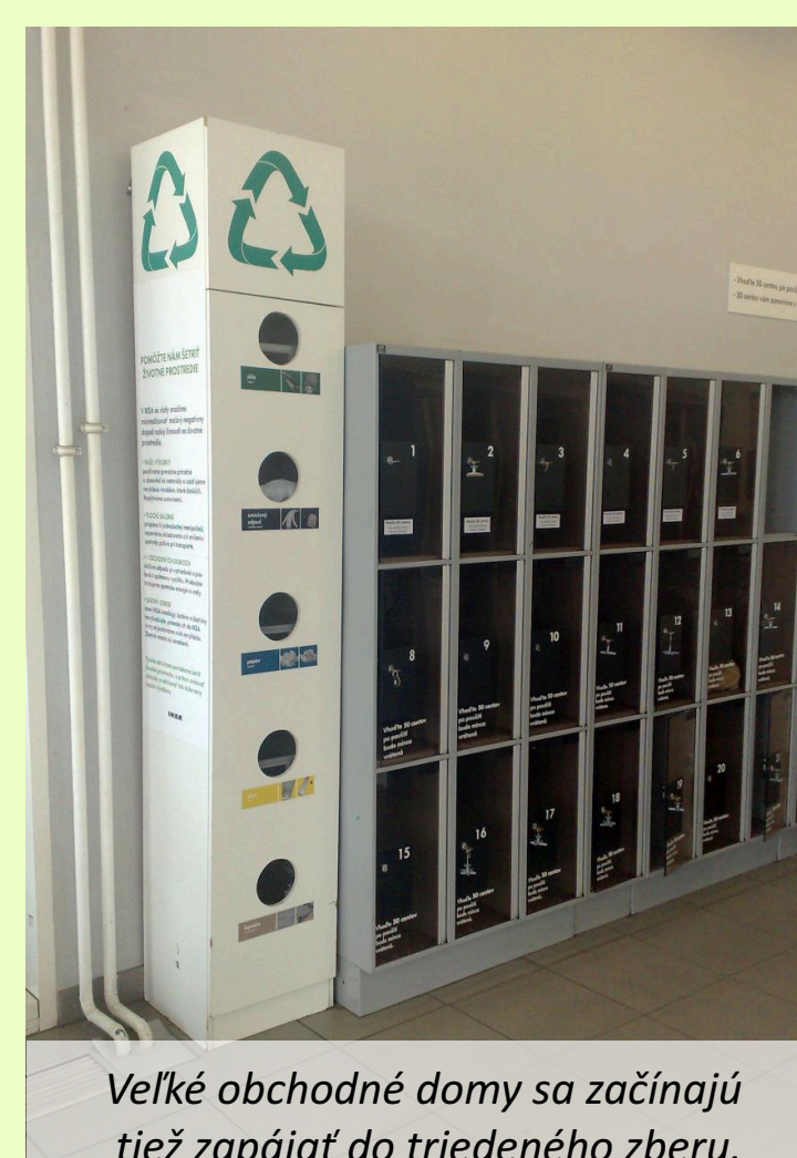
Veľké obchodné domy sa začínajú tiež zapájať do triedeného zberu.

Na triedenie v budovách si môžeme k tomuto účelu zakúpiť i špeciálne nádoby.