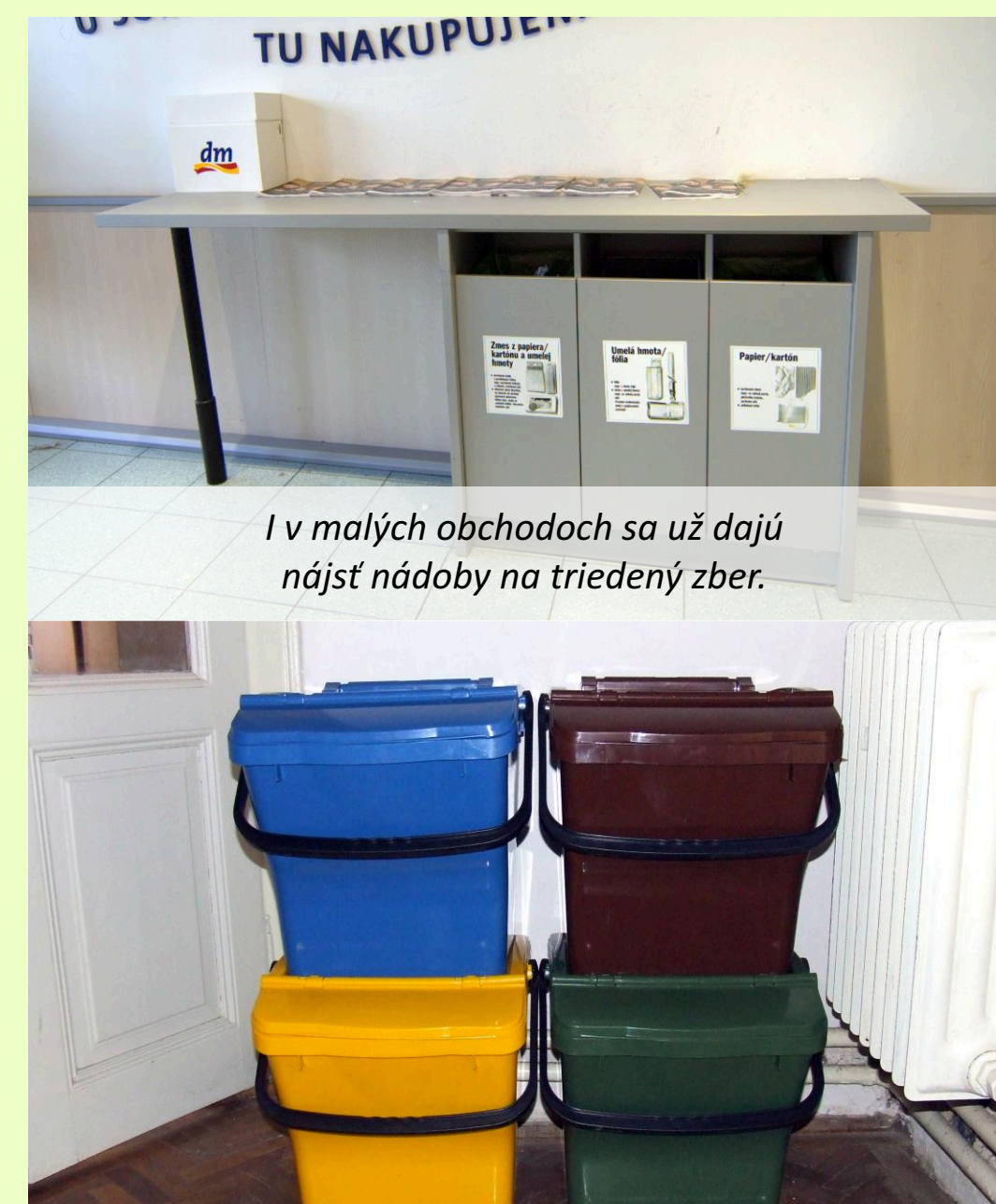
I v malých obchodoch sa už dajú nájsť nádoby na triedený zber.