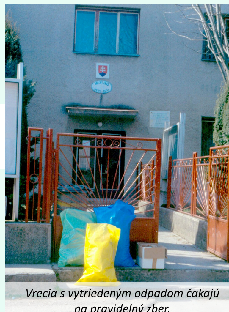
Vrecia s vytriedeným odpadom čakajú na pravidelný zber.

súčasťou Všeobecne záväzného nariadenia obce / mesta o komunálnych odpadoch a drobných stavebných odpadoch (VZN o odpadoch).