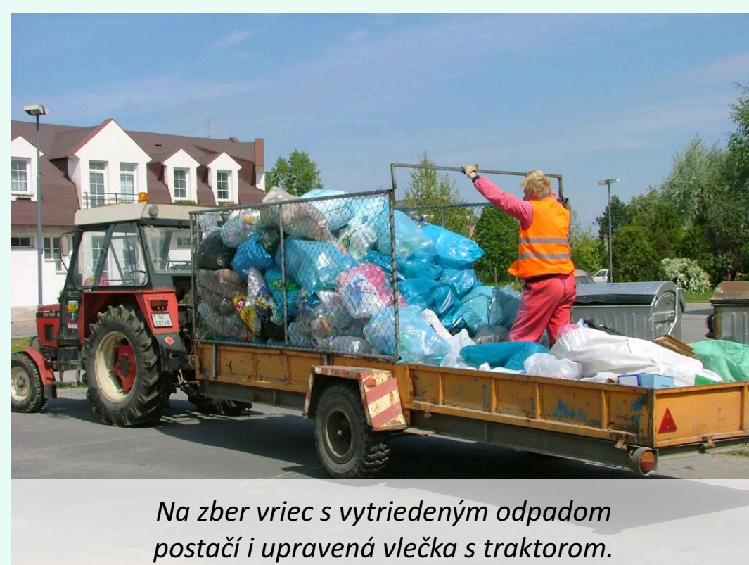
Na zber vriec s vytriedeným odpadom posťach i upravená vlečka s traktorom.